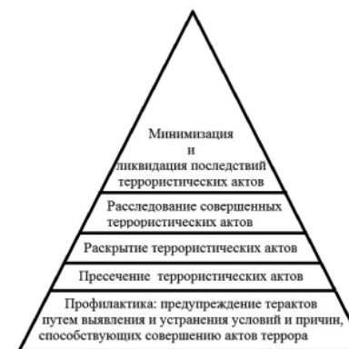
Рис. 1 Алгоритм борьбы с терроризмом в России

Россия в борьбе с терроризмом прилагает все силы, чтобы избежать опасных и непредсказуемых последствий, которые уже переживает человечество. В нашей стране разработан алгоритм борьбы с терроризмом (рис. 1) [8].