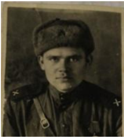
после ранения под Брянском 1943 год