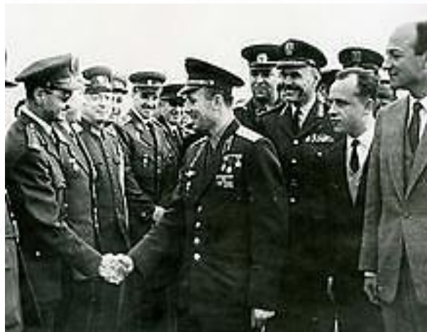
Юрий Гагарин во время зарубежного визита в Египет, 5 февраля 1962 года