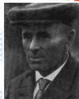
ГАГАРИН Алексей Иванович