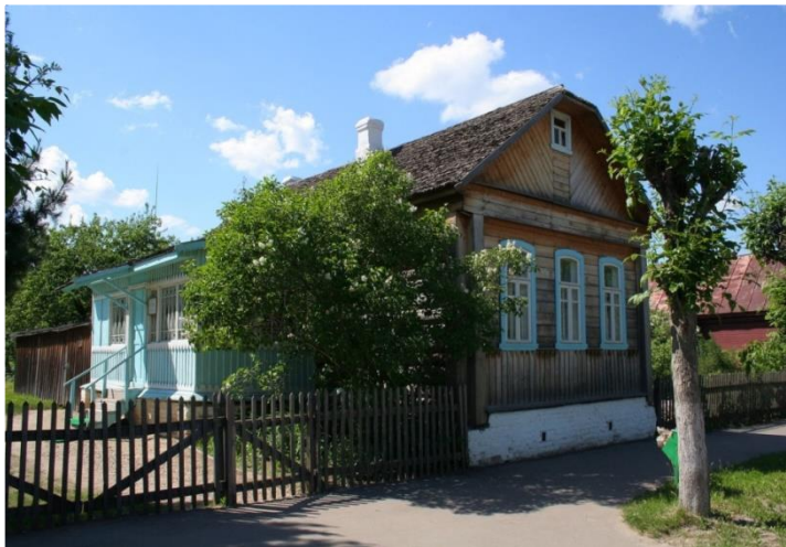
Дом, в котором Юрий Гагарин жил в школьные годы. Город Гагарин (бывший Гжатск)