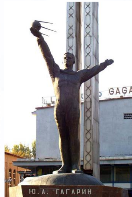
Памятник Юрию Гагарину в Ташкенте