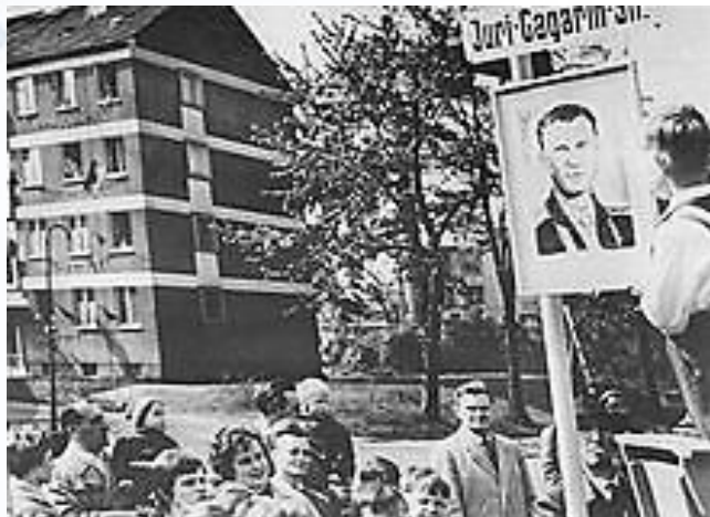
Жители Карл-Маркс-Штадта на улице, названной именем Юрия Гагарина, 6 мая 1961 года

Почти через месяц после полёта Юрия Гагарина отправили в первую зарубежную поездку с так называемой «Миссией мира». Первый космонавт посетил Чехословакию, Финляндию, Англию, Болгарию и Египет.