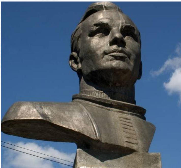
В штате Нью-Йорк поставят памятник Гагарину

Имя Гагарина носят учебные заведения, улицы и площади многих городов мира. Именем Гагарина назван кратер на обратной стороне Луны.