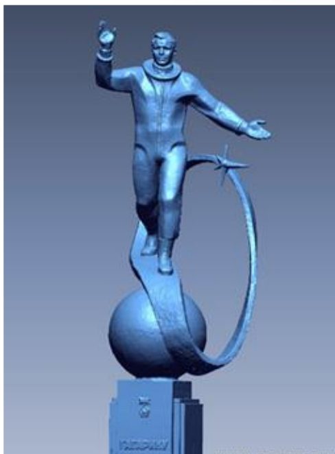
Памятник Юрию Гагарину в Лондоне