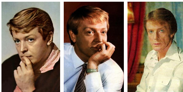
Легенды мирового кино. Олег Стриженов

наградами. Лауреат Национальной кинопремии "Золотой Орел" за вклад в отечественный кинематограф. Лауреат премии МВД СССР за роль полковника Данилова в фильме "Приступить к ликвидации". Имеет медаль "За доблестный и самоотверженный труд в период Великой Отечественной войны".