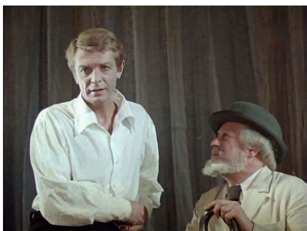
Телеспектакль Чайка Московский художественный академический театр имени М. Горького