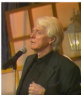
Маркиза. Олег Стриженов. Стихи Сергея Есенина

«Три мушкетёра», инсценировка - д'Артаньян «Дон Карлос», радиоспектакль - Дон Карлос «Тропою грома», радиоспектакль – Том «Спартак», радиокomпозиция – Спартак «Третье купе», радиоспектакль - Сергей Есенин «Анна Снегина», радиокomпозиция - Сергей Есенин «Жорж Санд», радиоспектакль – Шопен «Ференц Лист», радиоспектакль – Лист «Маскарад», радиоспектакль – Арбенин «Егор Булычов и другие», спектакль МХАТ – Тятин «Без вины виноватые», спектакль МХАТ – Незнамов «Чайка», спектакль МХАТ – Треплев «Письмо матери», «Ответ», «Чёрный человек» - Сергей Есенин 1968 - радиоспектакль Айвенго - «Айвенго»