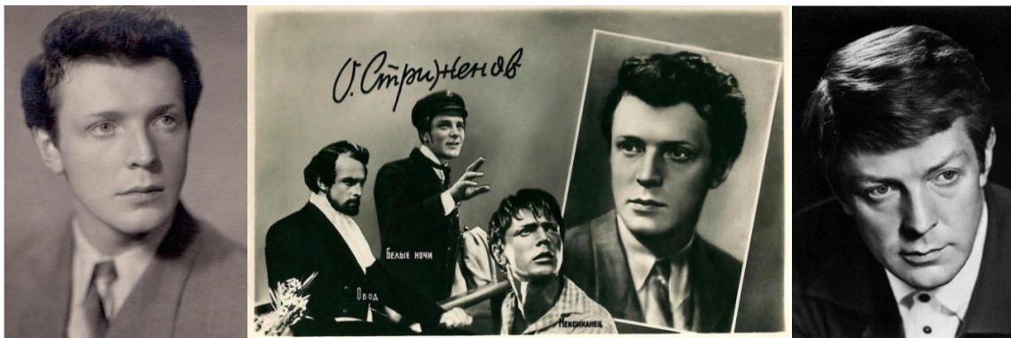
Олег Стриженов. Любовь всей жизни.

Олег Александрович Стриженов: знаменитый советский и российский актёр театра и кино. в 1953 году окончив Театральное училище им. Щукина , Олег Стриженов по распределению уехал работать в Таллин (Эстония), где стал актером Государственного русского драматического театра в Таллине . На сцене этого театра он сыграл роль Незнамова в спектакле "Без вины виноватые". Спектакль имел большой успех у зрителей. Затем Олег Стриженов переехал в Ленинград, где продолжил актёрскую карьеру в Театре драмы им. Пушкина . В 1967 году Стриженов вернулся на театральную сцену, стал актером МХАТа. В театре актер прослужил до 1976 года. На сцене МХАТа Олег Стриженов сыграл в таких спектаклях, как "Егор Булычов и другие", "Мария Стюарт", "Чайка", "Три сестры" и многих других. С 1957 года по настоящее время состоит в труппе Театра Киноактёра .