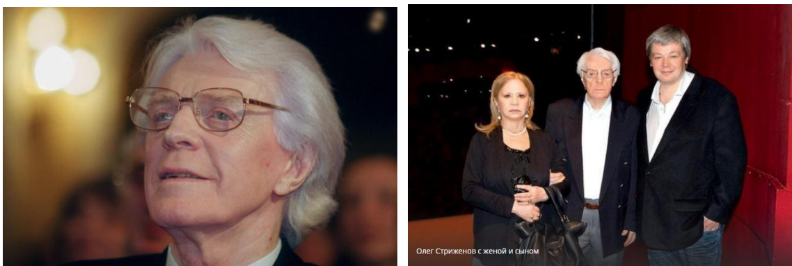
История мечтателя. Олег Стриженов