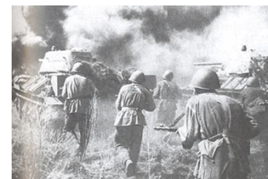
Битва на Курской дуге. Лето 1943