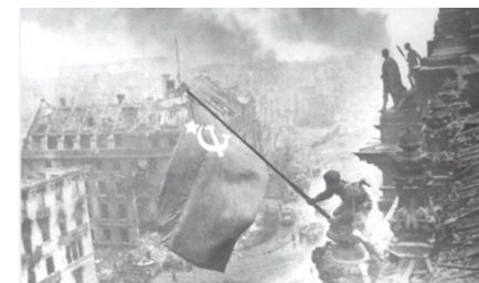
Знамя Победы над Рейхстагом

По материалам книги «Бессмертный ПОЛК. Непридуманная история.»