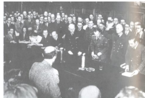
Министр иностранных дел Германии И. Риббентроп на пресс-конференции объявляет о начале войны против СССР, 22 июня 1941 г., 12 часов