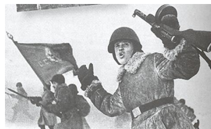
Прорыв блокады 18 января 1943