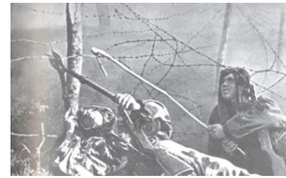
Саперы проделывают проходы

Солдаты штрафного батальона страдали от голода и цинги