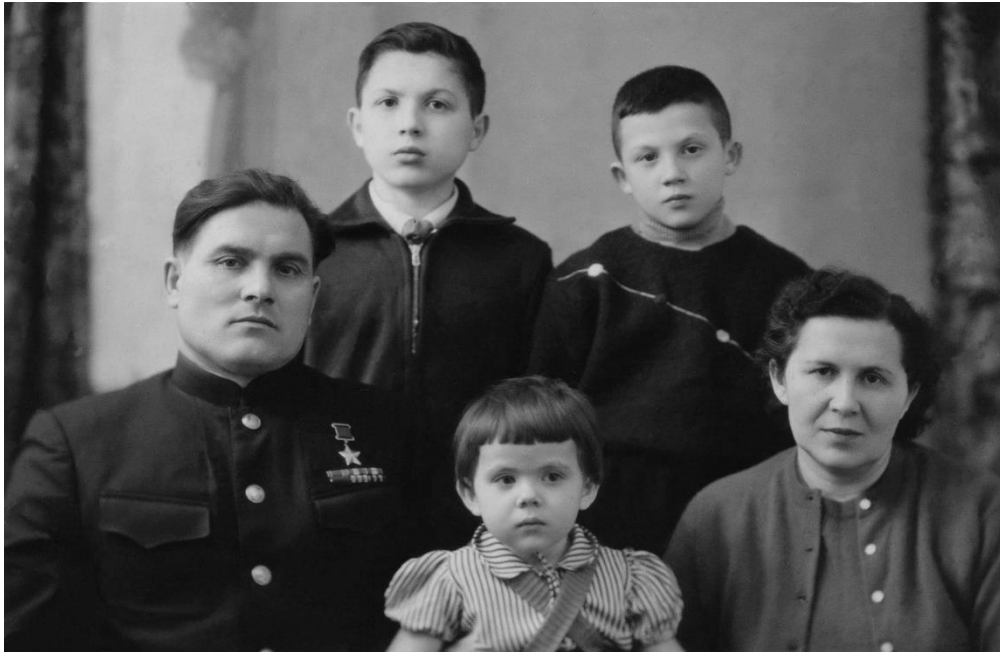
Михаил Девятаев с женой и детьми

Спустя 12 лет, вскоре после запуска первого искусственного спутника Земли, Девятаеву вручили Золотую Звезду Героя. Оказалось, что к этому приложил руку сам Королев.