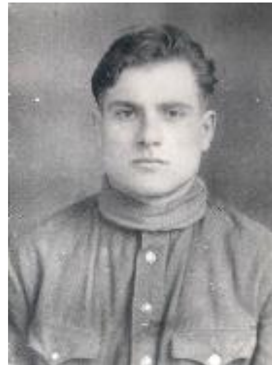
Михаил Девятаев. 40-годы