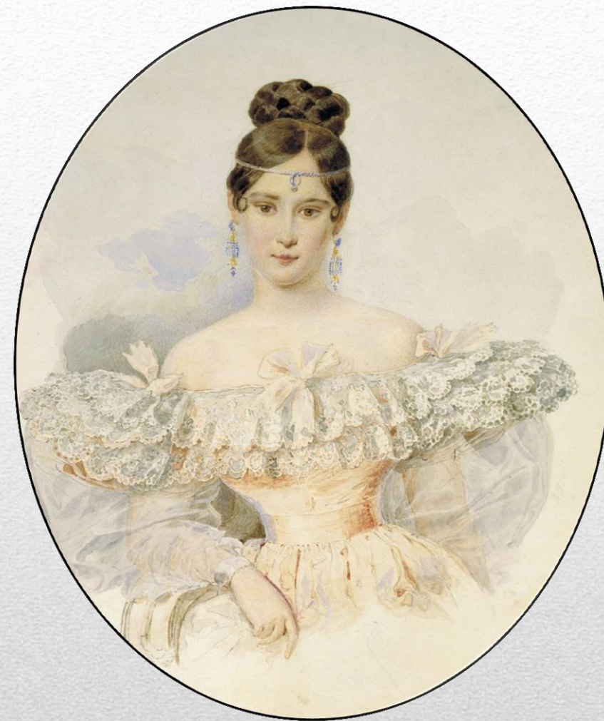
ГОНЧАРОВА Наталья Николаевна

Гончарова Наталья Николаевна (с 1831 года жена А.С. Пушкина) (27.08.1812 – 26.09.1863) Акварельный портрет работы А.П. Брюллова Впервые А.С. Пушкин увидел юную Наталью Николаевну зимой 1828 года на одном из московских балов... Мучительно долго длилось его сватовство... Венчание состоялось 18 февраля 1831 года в церкви Вознесения в Москве. В одном из писем к жене, он пишет: «Я должен был на тебе жениться, потому что всю жизнь был бы без тебя несчастлив...». Наталья Николаевна была не только любящей женой и доброй матерью детям, но и помощницей в служебных и хозяйственных заботах мужа. Не случайно именно к ней, делившей с ним радости, горести и мысли, обращено стихотворение-раздумье поэта: «Пора мой друг, пора!...». Кроме того Наталье Николаевне адресованы стихотворения «Нет, я не дорожу мятежным наслажденьем», «Мадонна»; упоминается она и в стихотворениях «Поедем, я готов» и «К вельможе».