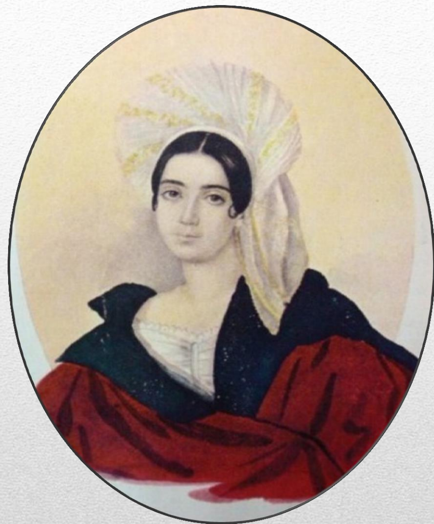
АБАМЕЛЕК Анна Давыдовна