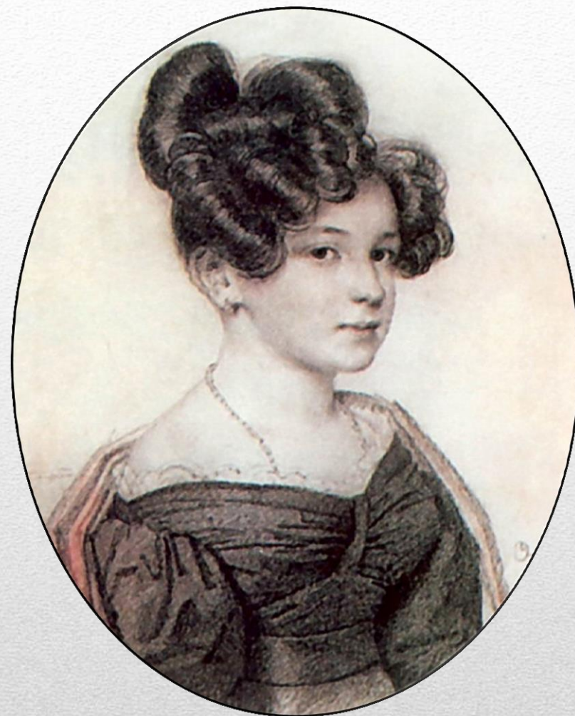
ОЛЕНИНА Анна Алексеевна