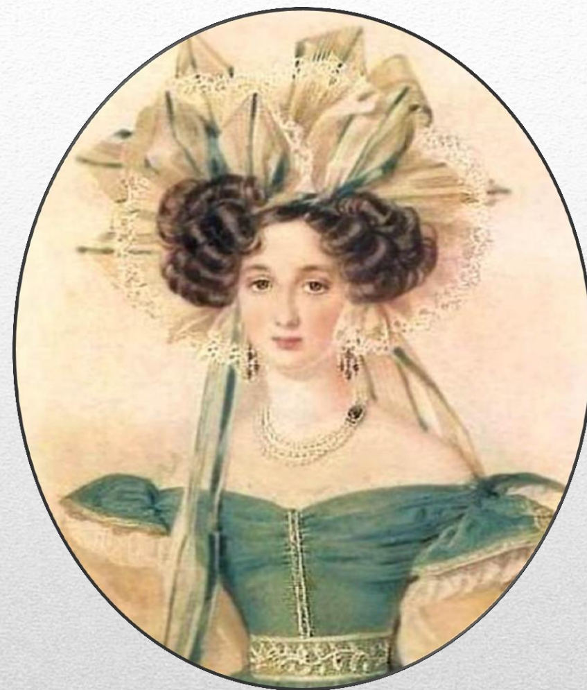
ВОРОНЦОВА Елизавета Ксаверьевна

На прощание Воронцова подарила Пушкину перстень-печатку. С этим талисманом он не расставался до самой смерти.