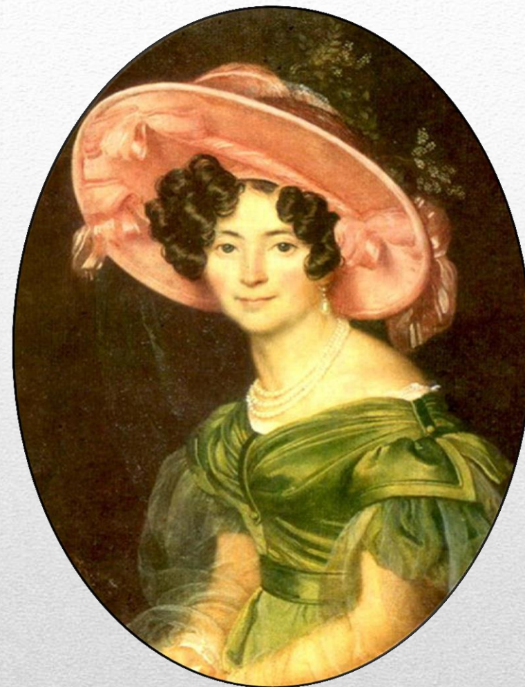
ВОЛКОНСКАЯ Зинаида Александровна

Среди рассеянной Москвы, При толках виста и бостона, При бальном лепете молвы Ты любишь игры Аполлона. Царица муз и красоты, Рукою нежной держишь ты Волшебный скипетр вдохновений, И над задумчивым челом, Двойным увенчанным венком, И вьется и пылает гений. Певца, плененного тобой, Не отвергай смиренной дани, Внемли с улыбкой голос мой, Как мимоездом Каталани Цыганке внемлет кочевой.