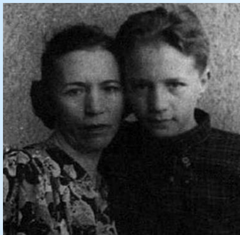
Маленький Эдуард Успенский с мамой