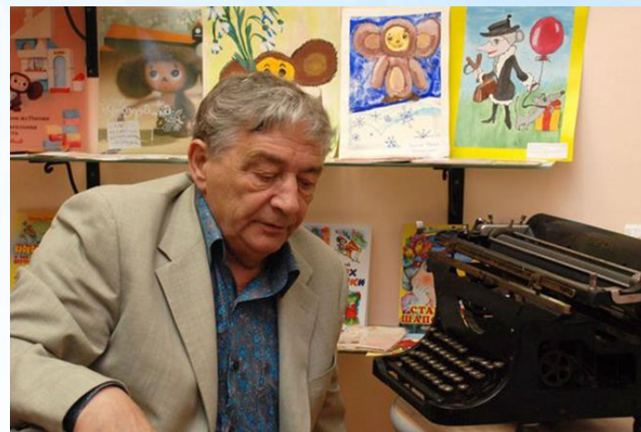
Эдуард Успенский продолжает писать книги для детей