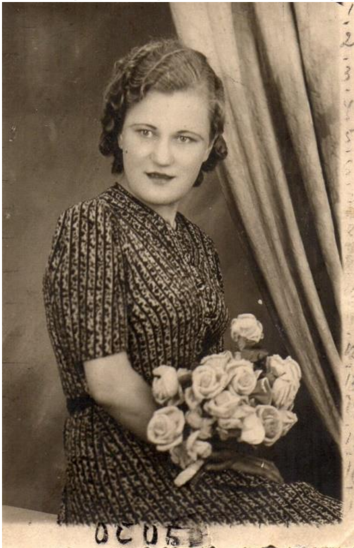
Фото моей прабабушки, которое сделано в 1945 году в Берлине.