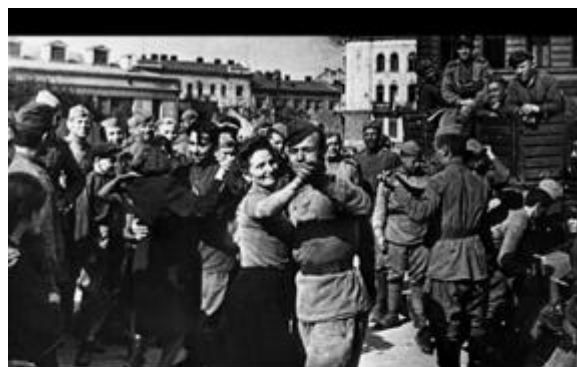
На улицах Львова в первые дни после освобождения города от немецких войск. Июль 1944 года

В конце моего эссе хочу сказать, что, возможно благодаря генетической памяти, моя мама стала врачом, так сказать «по зову крови». Доклад мне помогала делать она.