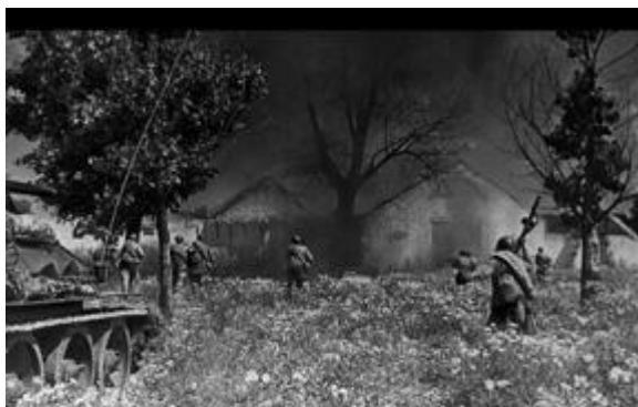
Бой на подступах к Львову в ходе Львовско-Сандомирской операции