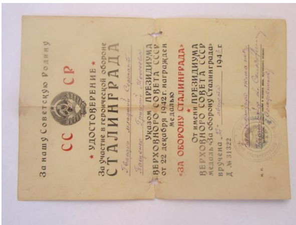
Удостоверение за участие в героической обороне Сталинграда.