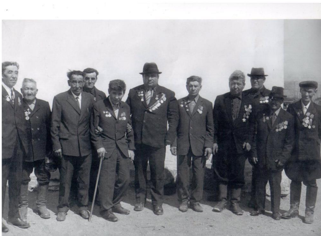
Прадед с другими ветеранами войны