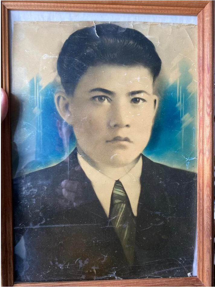
Фотография прадеда, когда он только отправился на войну.