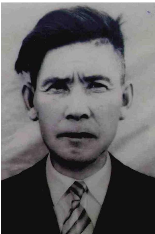
Фотография моего прадеда, представленная в книге про ветеранов.